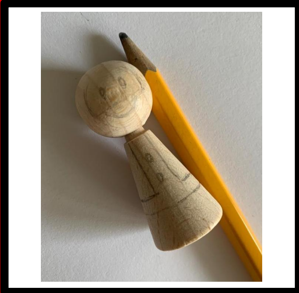
Teken globaal het figuur van de Kerstman.