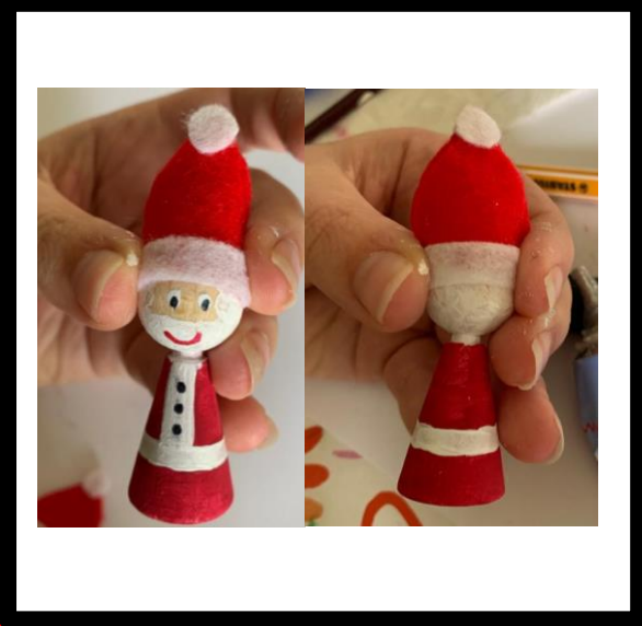
Plak de muts op de pop, houd vast tijdens drogen.