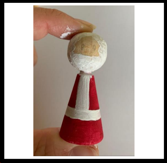
Verf de baard op het hoofd en laat drogen.