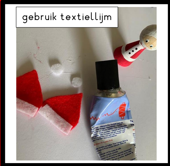
gebruik textiellijm Knip de witte details voor de muts uit en plak op.