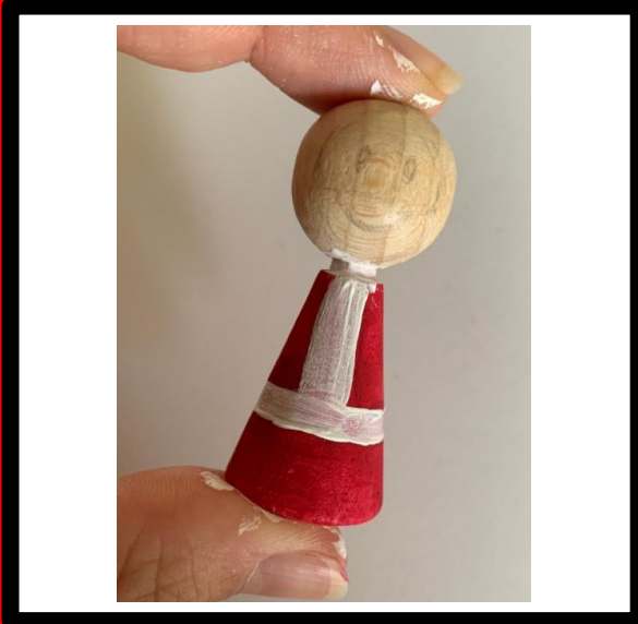
Verf de details op het lijf, de witte verf = 2 lagen.