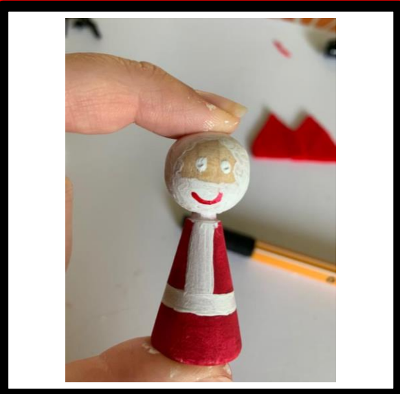
Verf de ogen en de mond, laat drogen.