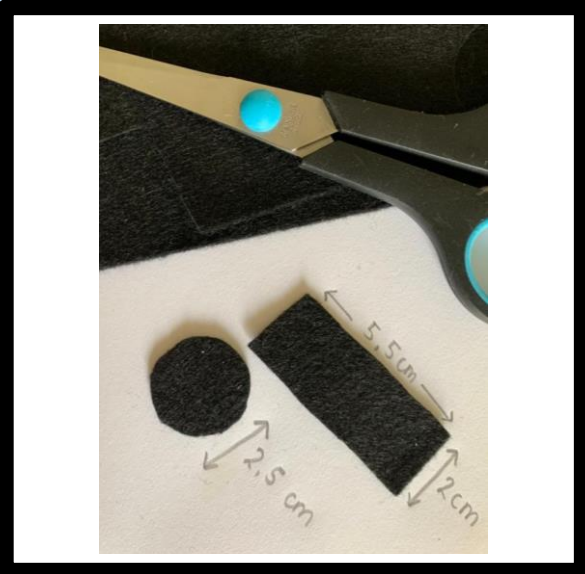
Knip de hoed uit vilt. Cirkel: 2,5 cm. Rechthoek: 5,5, cm bij 2 cm