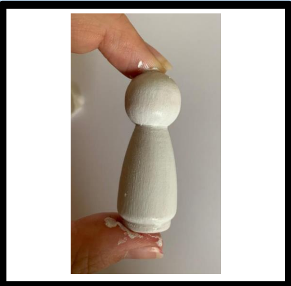
Verf de basislaag op het lijf en laat drogen.