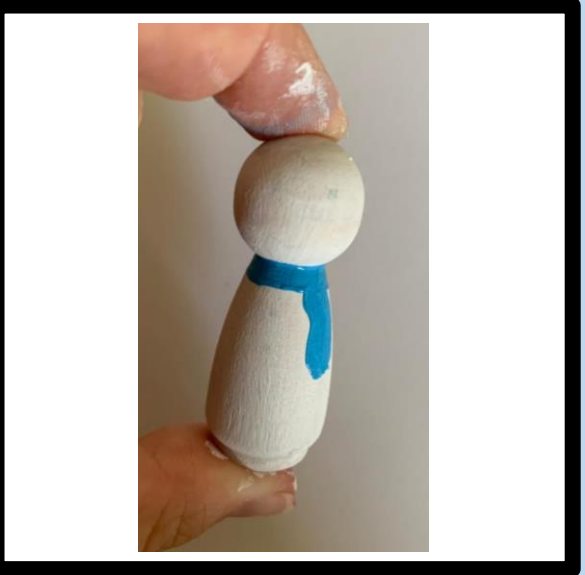
Verf de sjaal op het lijf en laat drogen.