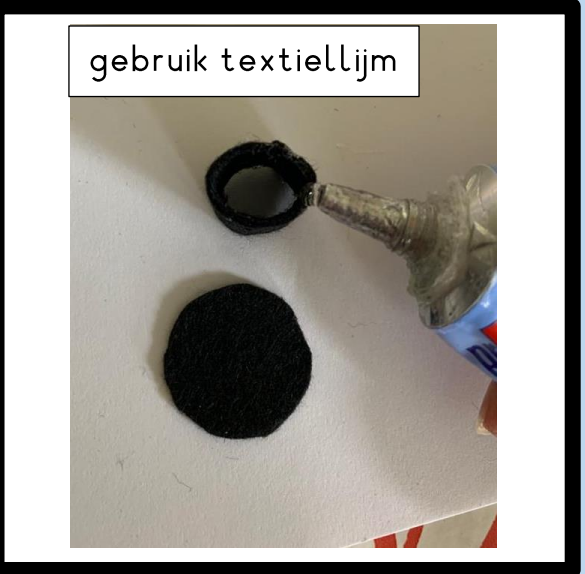
gebruik textiellijm Lijm de koker op de cirkel.