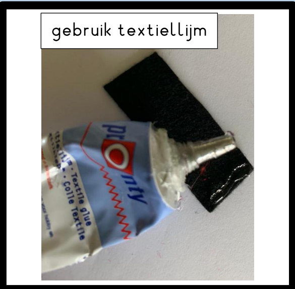
gebruik textiellijm Lijm de uiteindes van de rechthoek tot een koker.