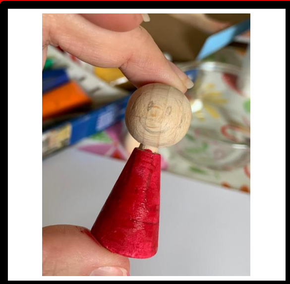
Verf de basislaag op het lijf en laat drogen.