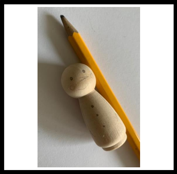
Teken globaal het figuur van de sneeuwpop.