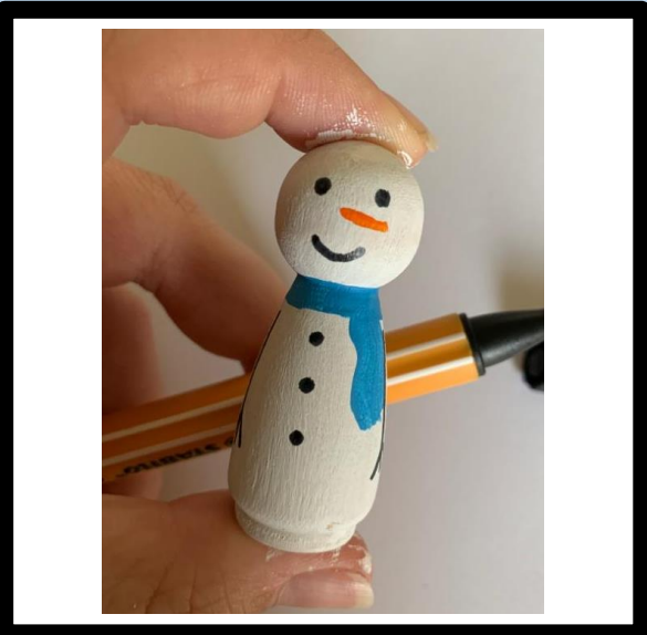
Teken de ogen, mond en knoop met stift.