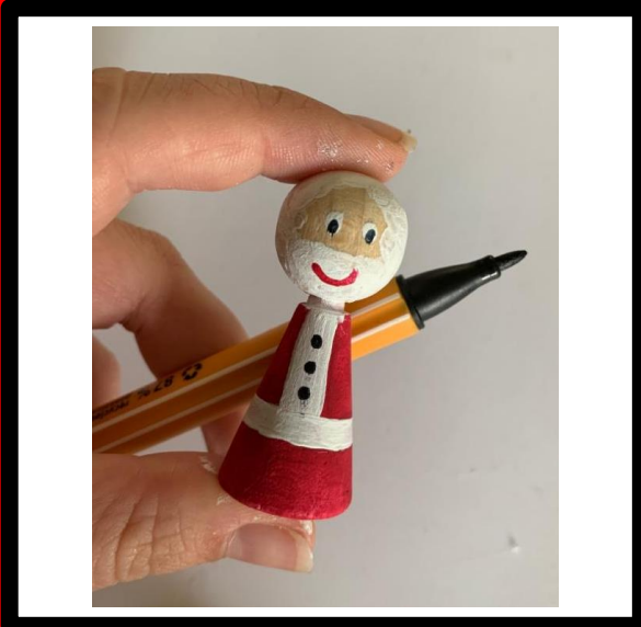
Teken de pupillen en knopen met stift.