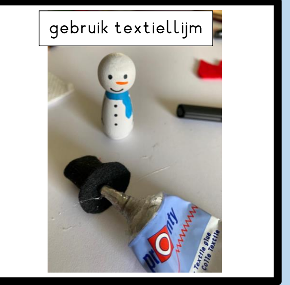
gebruik textiellijm Lijm de hoof op het hoofd van de sneeuwpop.